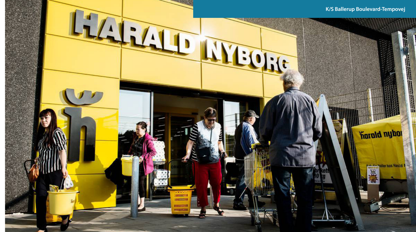
Referencefoto - fotoet er ikke af Ejendommen i Ballerup

Harald Nyborg A/S må derfor betegnes som en særdeles stærk Lejer.